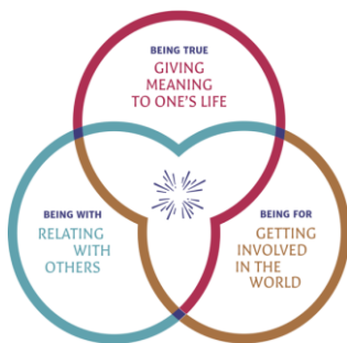
L'ADN de Fondacio

La réflexion d'une ancienne élève aide à faire ressortir l'impact de son année de formation à l'IFFAsia, sept ans plus tard :